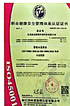
职业健康安全管理体系认证证书