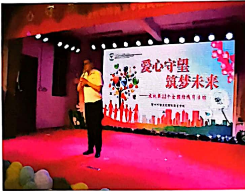
捐赠仪式上董事长发表讲话

上我最诚挚的祝福，孩子们都是上天派来的天使，虽然你们的翅膀有点受损，但是我相信，在我们这些爱心人士的帮扶下，你们会飞得更高，走得更远！