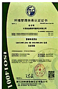
环境管理体系认证证书