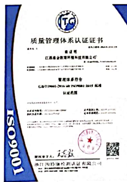
质量管理体系认证证书

公司通过 ISO 14001:2015/GB/T 24001-2016 环境管理体系认证和 ISO 45001:2018/GB/T45001 职业健康安全管理体系认证。并严格遵守环境保护相关法律法规要求和职业健康安全相关法律法规要求。