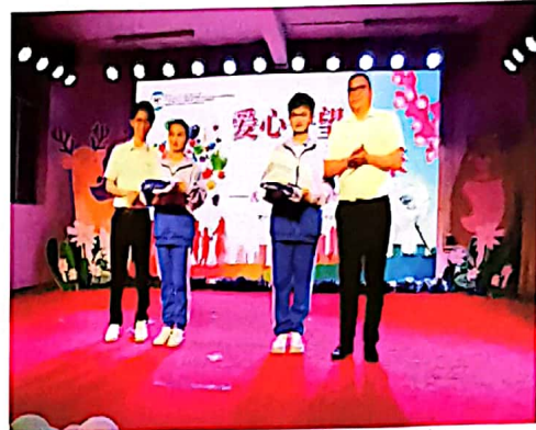
图为学生捐助校服物资